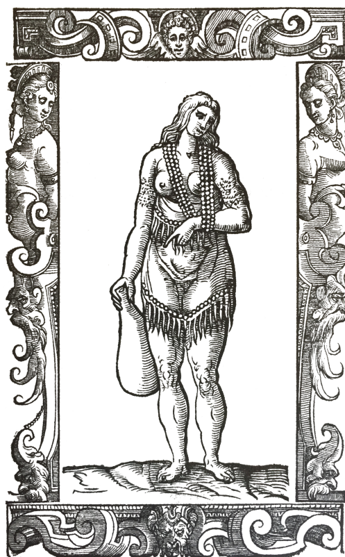
Grabado 3. Vecellio, Habiti antichi et moderni , f. 500v.

24. Sin embargo, las imágenes femeninas que muestran los territorios de Virginia (grabado 3 y 4) y Florida (grabado 5) tienen un menor grado de civilización. Esto se debe a