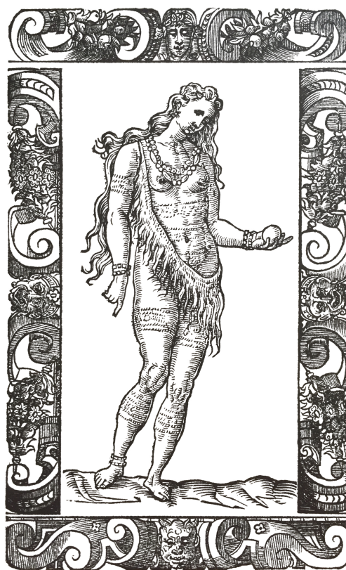
Grabado 5. Vecellio, Habiti antichi et moderni , f. 500v.

el cabello largo, que le cae sobre la espalda; no llevan ropas, a excepción de unas pieles de animales para cubrir sus partes vergonzosas y se enorgullecen de pescar; tienen vasos de una cierta materia perfectísima para cocinar, y mezclan juntos el pescado y otros frutos; viven sobriamente 39 .