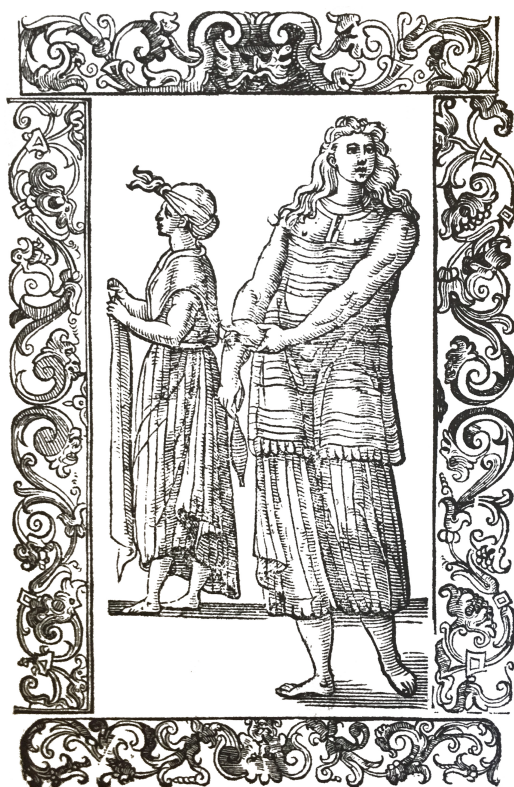
Grabado 2. Vecellio, Habiti antichi et moderni , f. 498v.

del cuerpo queda desnudo y el cabello les cae por la espalda. Hilan como aquí se ve. Hay otras que llevan una pieza blanca de tela u otro material sobre los hombros. Ahora obedecen a la Iglesia 35 .