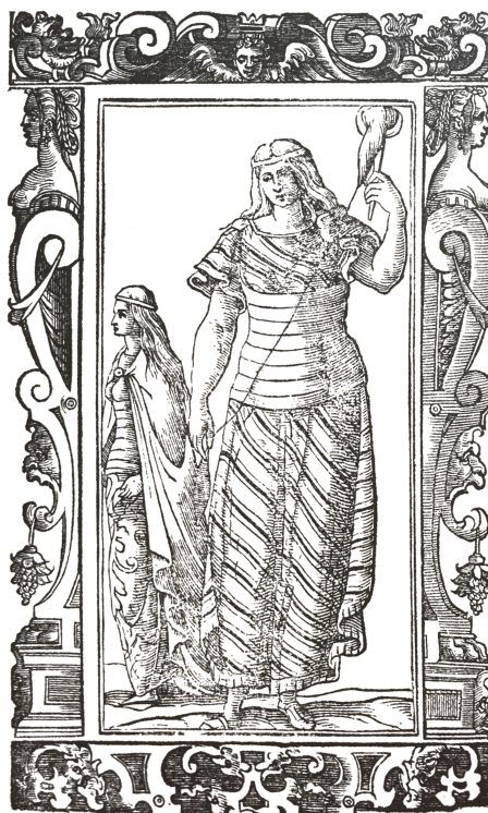
Grabado 1. Vecellio, Habiti antichi et moderni , f. 491v.

los pies y se la ajustan sobre la espalda con alfileres, y se lo ajustan a la cintura;