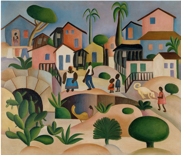
Figura 2. Tarsila do Amaral, Morro da Favela , 1924. Imagem disponível em < http://tarsiladoamaral.com.br/obras/ >

21. A autora aponta como os jornais da época comentavam essas celebrações: «Em um canto se formavam os cordões terríveis, ameaçadores, selvagens. Em outro canto reuniam-se os sambas, não menos terríveis e muito mais selvagens 42 ». Outra peça de 1929, citada por Mariana Aguiar, é «Seu Julinho Vem!» cujo enredo discutia as políticas remoções da época, o personagem Vagabundo, categorizado como malandro, resistia a proposta de urbanização do Morro da Favela 43 . Essas produções conversam com o movimento cultural modernista no Brasil, que a partir de 1922, procura introjetar como elementos de identidade nacional a figura dos negros, dos sambistas, dos malandros e dos favelados. É também nesse contexto, em 1924, que a artista Tarsila do Amaral produziu um quadro que retratava as favelas e sua população.