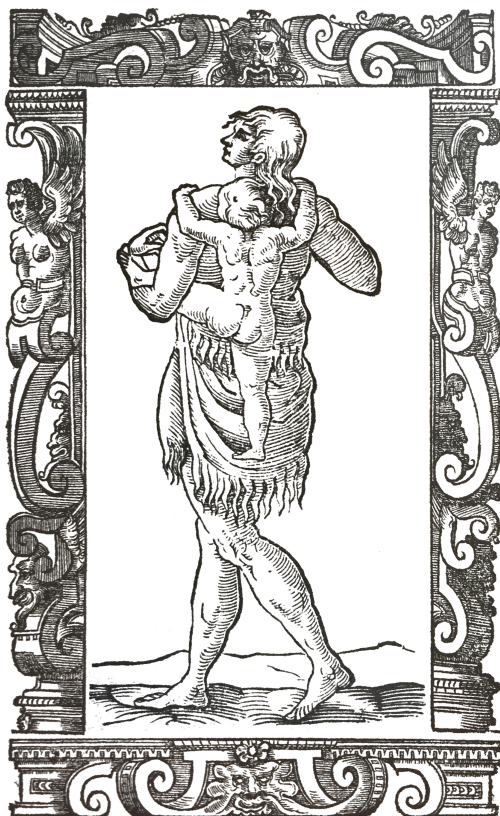
Grabado 4. Vecellio, Habiti antichi et moderni , f. 503 v.

Este hábito sirve tanto para las matronas como para las doncellas; aunque cierto es que las doncellas llevan los brazos apoyados en el pecho para cubrir las mamas, pero por lo demás no hay ninguna otra diferencia. El pelo les cae por los hombros; se cubren con pieles las partes de la vergüenza; llevan al cuello varias cadenas de cobre y se pintan maravillosamente. Portan unos vasos donde llevan agua y les complace cazar y pescar. [...] Las mujeres de la Isla de Virginia tienen un buen modo para llevar a sus niños, sentándolos sobre la espalda, como se ve en la impresión; llevan