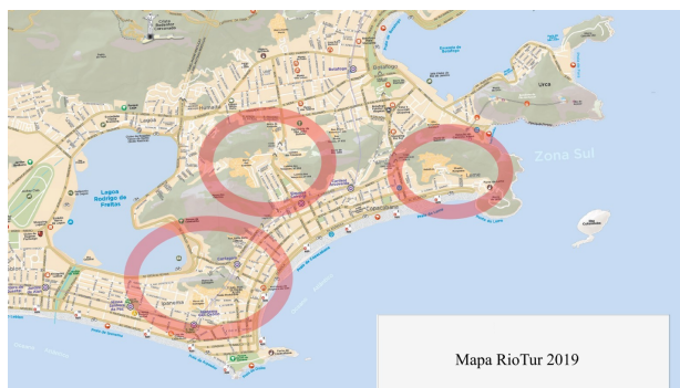
Figura 1. Mapa distribuído pela Rio Tur, 2019

2. A questão a ser evidenciada, por mais óbvia que pareça, é que os lugares onde ocorrem as chacinas e os territórios frequentados pelos turistas não costumam ser os mesmos.