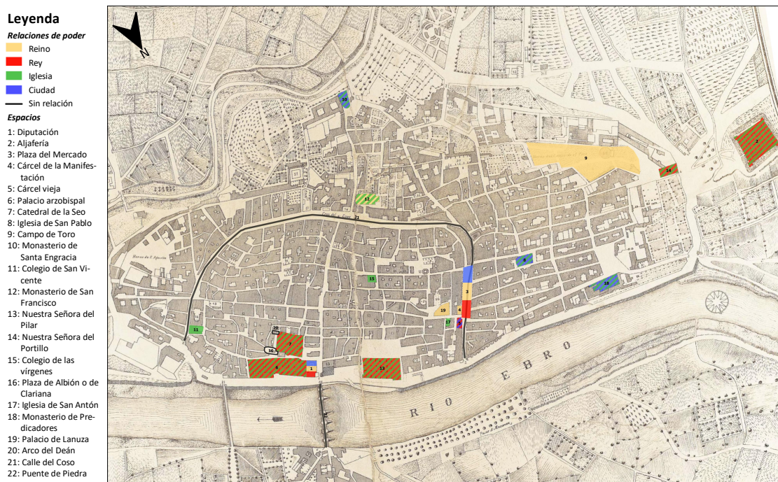
Figura 1. Representación de Zaragoza según Gonzalo de Céspedes y Meneses y Lupericio Leonardo de Argensola

Elaborado a partir de Plano y Vista de la Ciudad de Zaragoza por el Septentrión . Carlos Casanova / Juan Mora Insa, AHPZ, MF_MORAIND/0579.